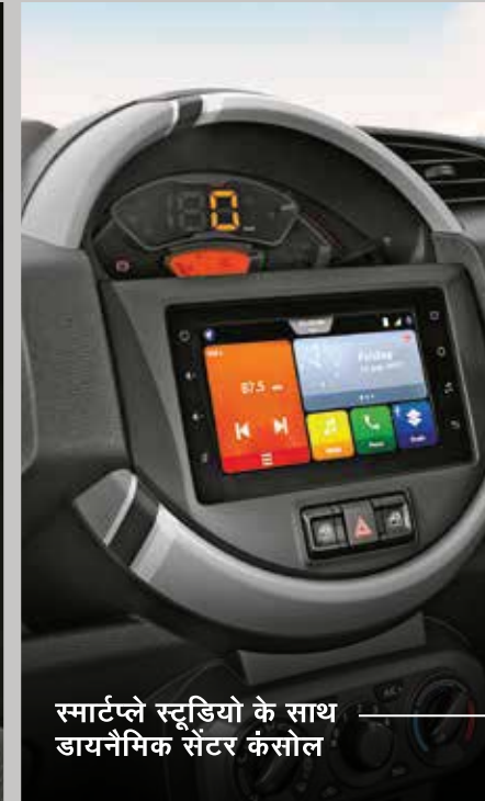
स्मार्टप्ले स्टूडियो के साथ डायनेमिक सेंटर कंसोल