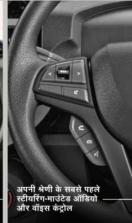
अपनी श्रेणी के सबसे पहले स्टीयरिंग-माउंटेड ऑडियो और वॉइस कंट्रोल