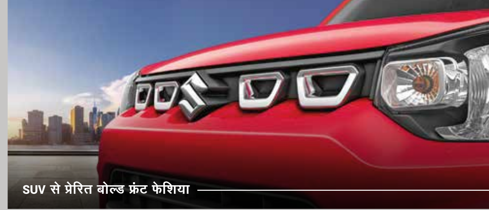
SUV से प्रेरित बोल्ड फ्रंट फेशिया