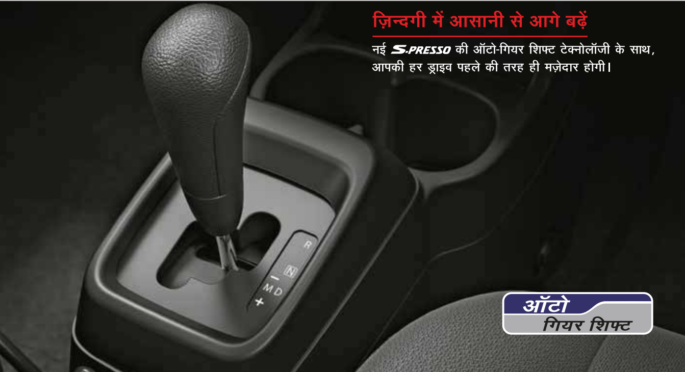
ऑटो गियर शिफ्ट

नई S-PRESSO की ऑटो-गियर शिफ्ट टेक्नोलॉजी के साथ, आपकी हर ड्राइव पहले की तरह ही मज़ेदार होगी।