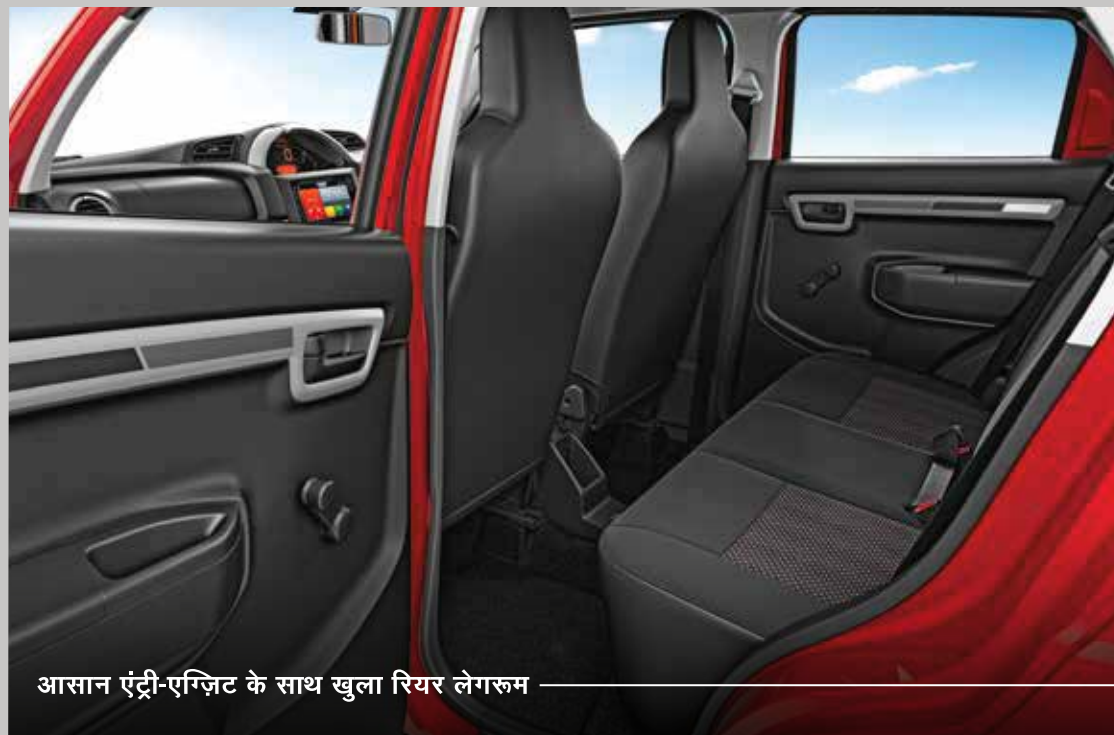
आसान एंट्री-एग्जिट के साथ खुला रियर लेगरूम