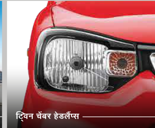
ट्विन चेंबर हेडलैंप्स