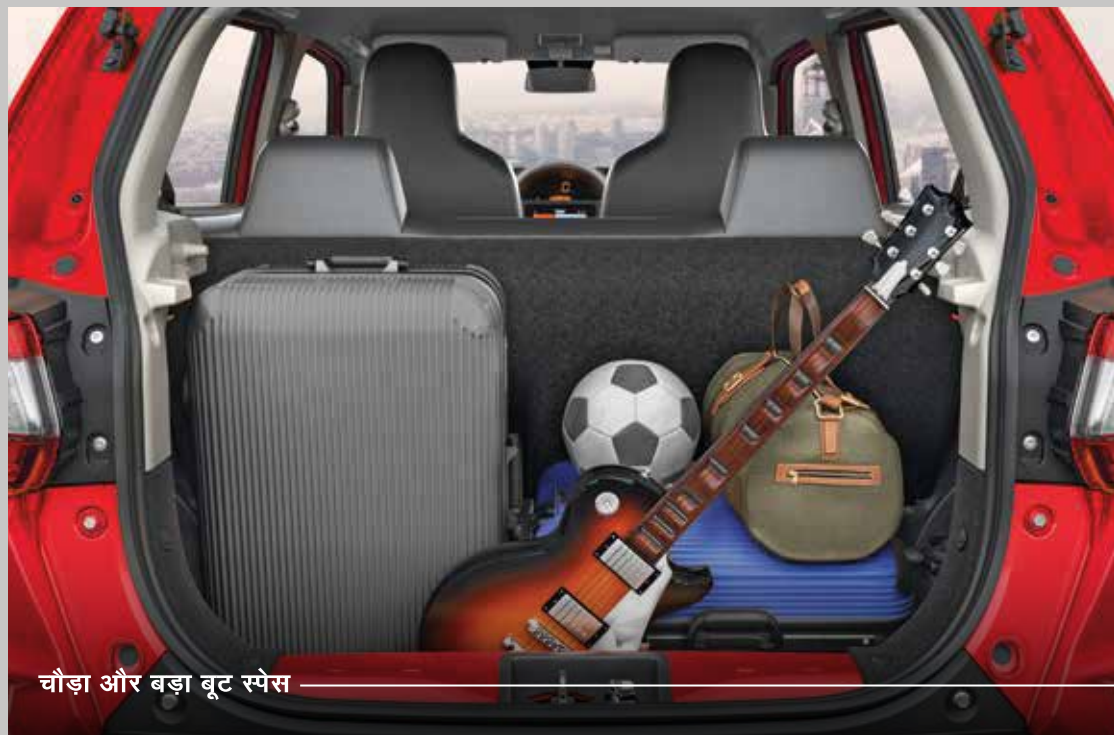
चौड़ा और बड़ा बूट स्पेस

S-PRESSO के दरवाज़े खोलते ही ये आपको कभी ना खत्म होने वाले रोमांच की दुनिया में ले जाएगी। यह सब इसकी कमांडिंग हाई-व्यू सीटिंग की वजह से है जो आपको अपने आस-पास की मज़ेदार चीज़ें देखने में मदद करती है। इसके अलावा, इसका डायनेमिक सेंटर कंसोल, अपनी श्रेणी के पहले स्टीयरिंग माउंटेड ऑडियो और वॉयस कंट्रोल और शानदार कलर एक्ससेंट आपको ड्राइव शुरू करने से पहले ही ज़िंदादिल महसूस कराते हैं।