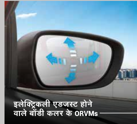
इलेक्ट्रिकली एडजस्ट होने वाले बाँडी कलर के ORVMs

आप अपने हर दिन को ज़्यादा खास कैसे बनाएँगे? ये बहुत ही आसान है। इसके लिए चाहिए जोश, उत्साह और कुछ छोटे-छोटे सरप्राइज़। Maruti Suzuki S-PRESSO में आपको बिल्कुल यही सब मिलेगा। बस इसके स्टीयरिंग व्हील के सामने बैठें और एक जोश भरे ज़िंदगी के सफ़र की ओर तेज़ी से आगे बढ़ें। क्योंकि रोमांच सिर्फ़ एक एहसास नहीं है, बल्कि एक अनुभव है। तो, क्या आप भी कुछ ज़्यादा के लिए बने हैं?