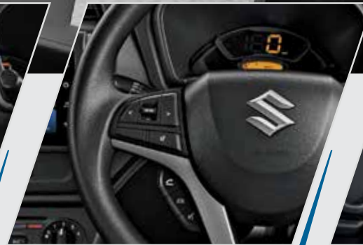
स्टीयरिंग माउंटेड ऑडियो और वॉइस कंट्रोल