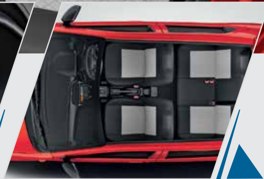
1 st इन सेगमेंट 4 स्पीकर्स