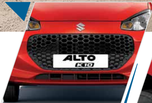
हनीकॉम्ब ग्रिल के साथ यूथफुल और मॉडर्न डिज़ाइन

अब अपने एक खास हमसफ़र Alto K10 के साथ पायें कामयाबी का एहसास। इसका स्टाइल और मॉडर्निटी दोनों एक साथ मिलकर इसे एक ज़बरदस्त लुक देते हैं।