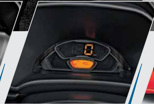
शानदार डिजिटल स्पीड डिस्प्ले वाला स्पीडोमीटर