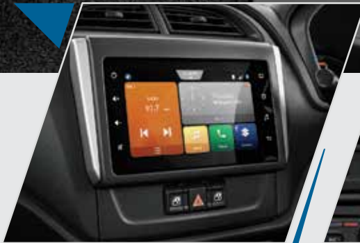
स्मार्टफोन नैविगेशन के साथ स्मार्टप्ले स्टूडियो

Alto K10 आधुनिक इंटीरियर और अपडेटेड टेक्नोलॉजी के साथ आती है, जो कम्फर्ट और वास्तविकता का एकदम सही मेल है।