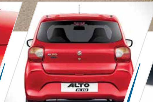
ट्रेंडी रियर कॉम्बिनेशन लैप्स