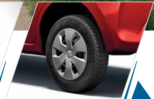
हनीकॉम्ब व्हील कवर के साथ 145/80 R13 टायर्स